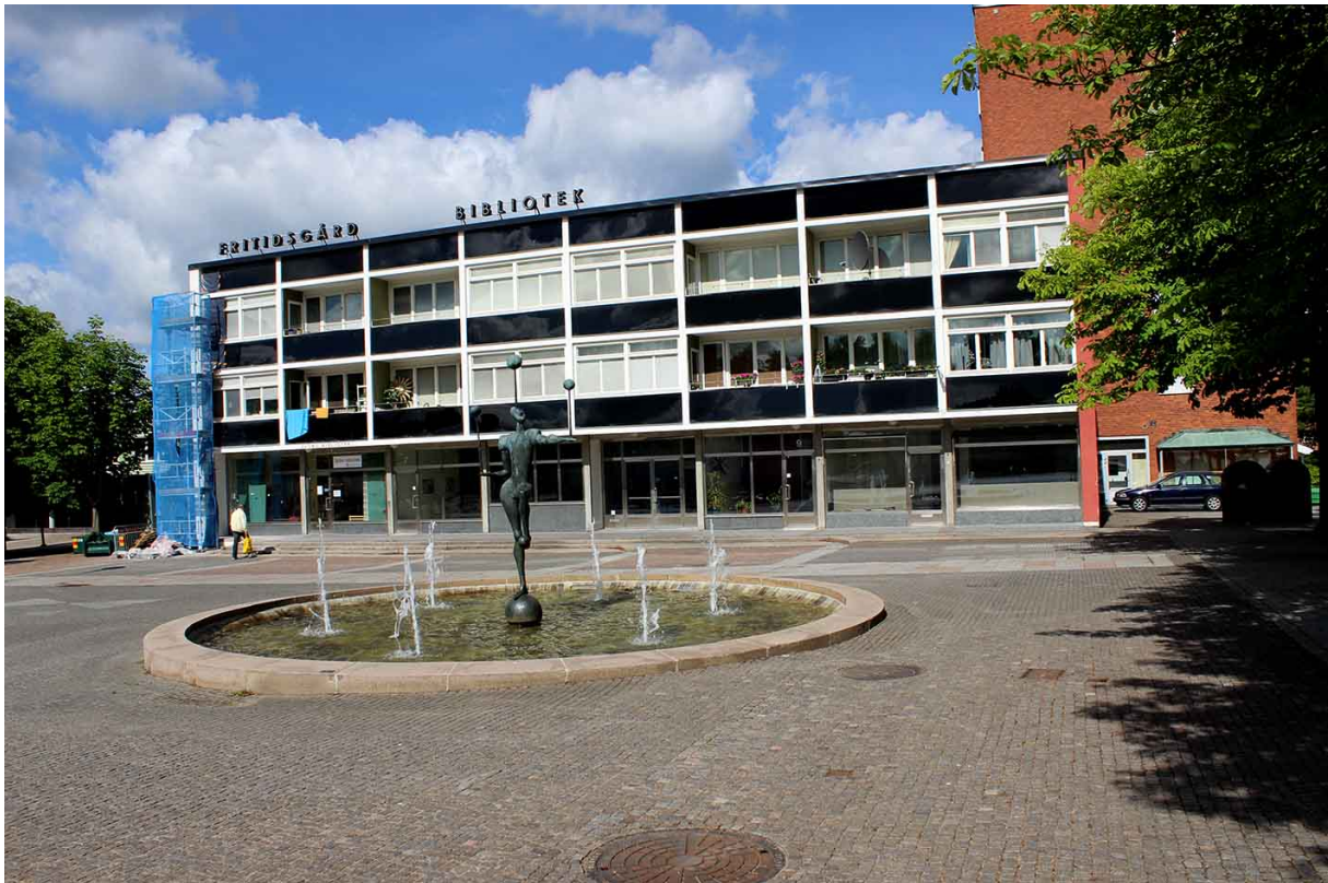
Biografen Olympia på Sjöbo torg

Fick förmånen att komma in och fotografera biografen, så totalt blir det 8 bilder jag kommer att visa i bloggen. Byggnaden uppfördes år 1960 så biografen hade väl sin premiär 1960 och när den lades ner har jag inte fått fram ännu. Men den 13 augusti 1975 var det premiär för nya biograf Olympia i Fenix gamla lokaler på Stora Brogatan – Holmsgatan så det måste varit runt 1975 som man lade ner biografen på Sjöbo.