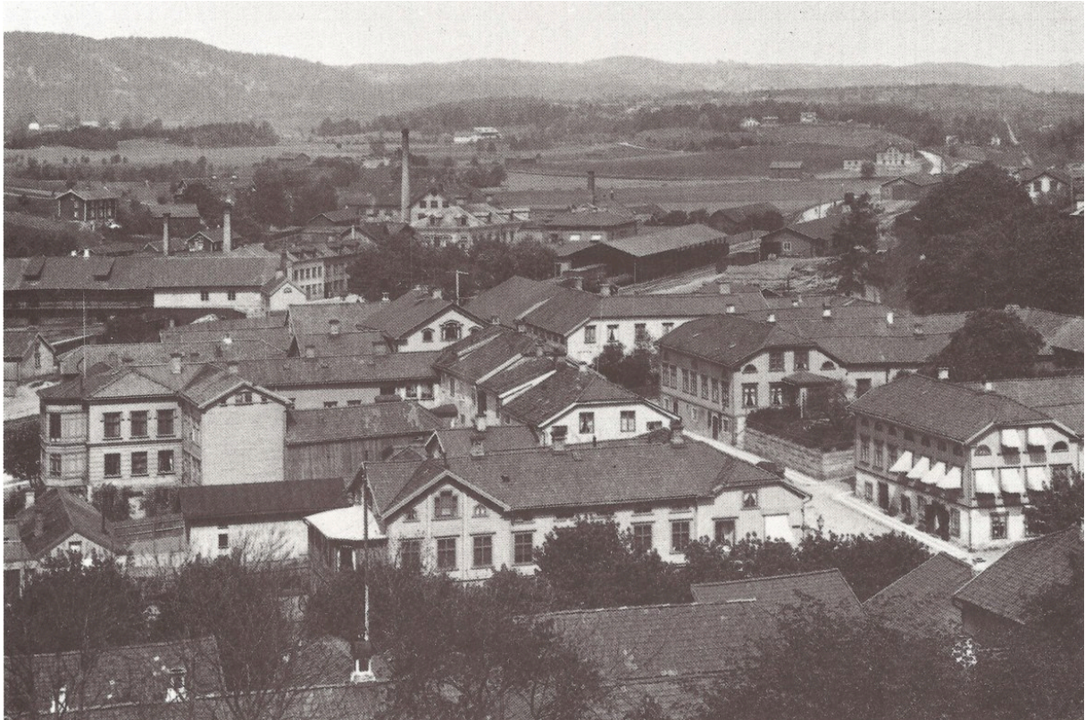
Vy Från Caroli Mot Norr 1890

En gammal bild från år 1890 som troligtvis är fotograferad från tornet på Carolikyrkan. Det är inte mycket som finns kvar i dag, men vilken idyll man ser alla dessa små hus lite småfabriker och stora öppna ängar. Gatan som vi ser till höger på bilden är Österlånggatan och träden som vi ser är Yxhammarsgatans allé. Jämför denna bild om en bild som jag tog ifrån Kyrkans torn den 15 oktober 2015 det är 125 år skillnad mellan bilderna.