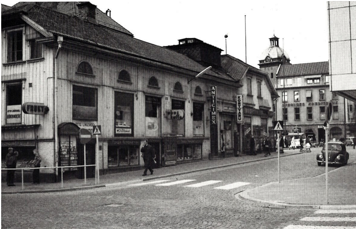
Österlånggatan Stora Torget i Bakgrunden 1961

Korsningen Österlånggatan – Lilla Brogatan, det nybyggda Tempohuset i höger bildkant och bilden är fotograferad år 1961. Alltså samma år som Tempo invigdes. Stora Torget i bakgrunden och det är innan rivningen började, så det enda hus som finns kvar på bilden är Tempohuset och givetvis Carolikyran. Jag förstår inte hur man kan låta hus förfalla så mycket så att det inte finns något annat alternativ till att riva husen.