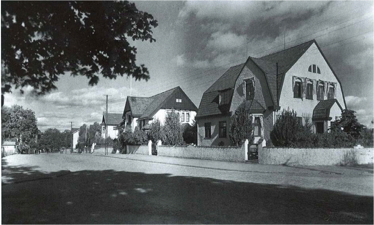
Varbergsvägen slutet av 1920-talet