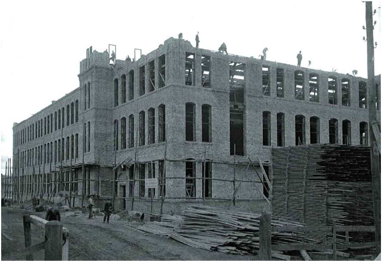
Åkerlunds Bomullspinneri på Druvefors