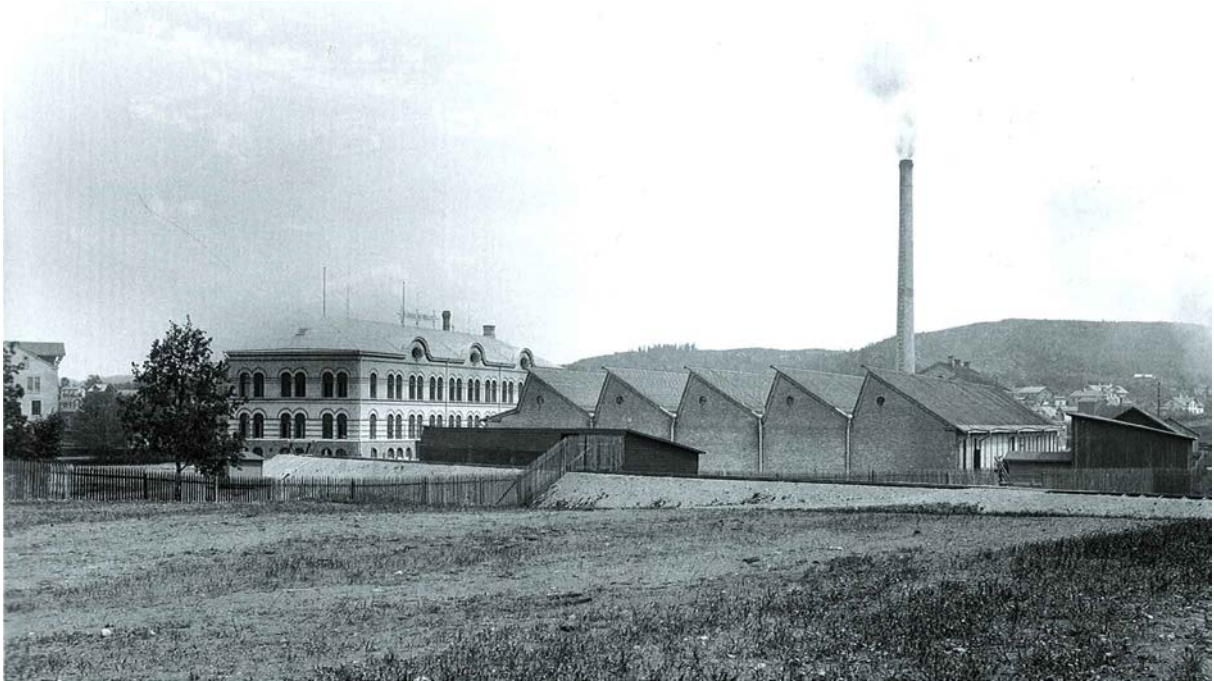
Kilsunds Fabriker år 1905

Kilsunds AB bildades år 1896 för att tillverka helylle klädnings- och kapptyger. Under de första åren så utfördes färgning och beredning av färdig väv i Tyskland men på grund av långa och tidsödande transporter så uppförde man ett eget färgeri- och appreturbyggnad år 1898. Verksamheten omfattade sedan av siden- och ylleväv som färgeri, blekeri och beredningsverk. Till en början så hade Kilsund 80 vävstolar men efter 10 år efter starten hade vävstolarna ökat till 220 vävstolar och för att driva alla dessa hade företaget en ångmaskin.