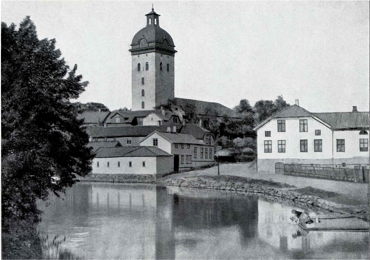
Berglundska gården omkring 1885