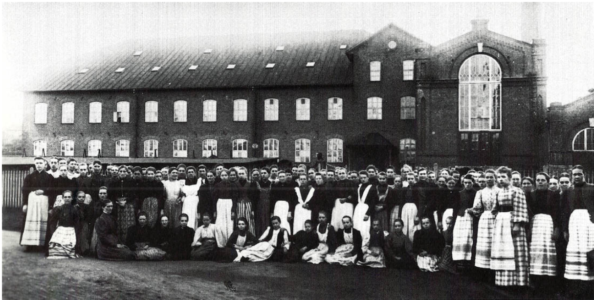
Vävarstaden Borås 1871-1890 Del 5