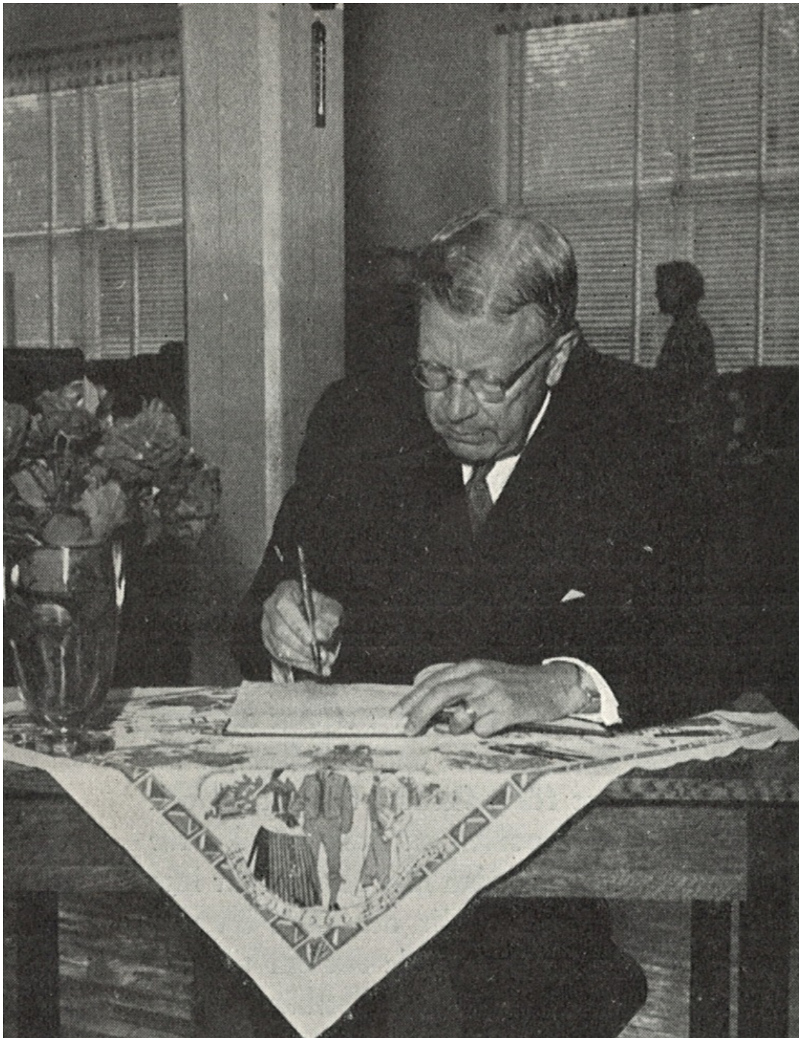
Kungabesöket i Rydboholm 1951