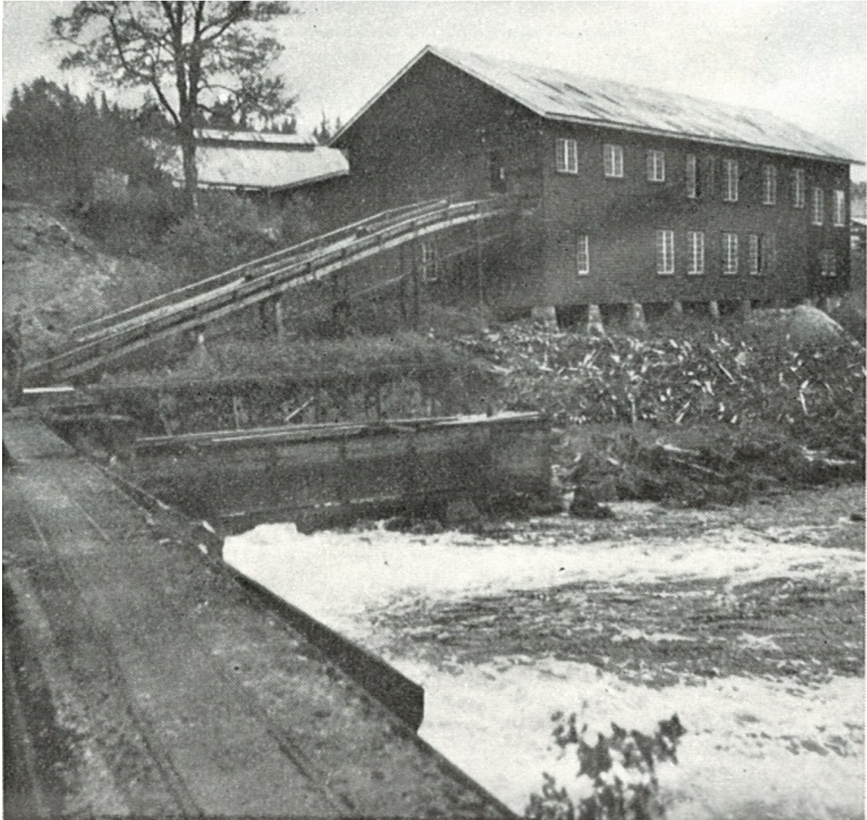
Sågen i Viskafors

För snart 119 år sedan yttrade en känd skogsman: "Allt vad skogen producerar kan användas, allt vad vi behöver kunna vi få från skogen". Att han så snart skulle bli sannspådd trodde han nog ej själv. Den gångna kristiden har på ett slående sätt visat oss att allt vad vi behöver kan vi få från skogen. Skogen ger oss bostäder, möbler, husgeråd, värme, delvis kläder, träbiff, massor av kryddor och smakämnen, parfymer, oljor för frisörer och målare, fernissor, hartser, skodon, papper, bolagscentilitrar och mycket annat. Största delen av skogsprodukterna går till sågverken för att förädlas till råvaror för byggnader och slöjd. När ett träd fälles kapas det i lämpliga längder, "apteras" för olika ändamål beroende av krökar och avsmalning. Ur de grövre träden uttages sågtimmer så långt detta går. Det kvarvarande blir massaved för pappersindustrin och brännved. De klenare träden upphugges till massaved, brännved, slanor och props, vilket exporteras i huvudsak till England och användes till gruvstöttor i kolgruvorna.