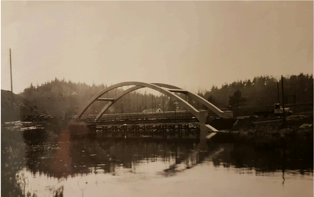
Bågbron i Rydboholm

Bron är i dag ett minne blott som revs 2014 och då hade den stått i 80 år. Den byggdes år 1934 och den har varit som ett monument i Rydboholm. Det var synd att man inte kunde bevara bron och byggt den nya bron bredvid den gamla. Man saknar den när man åker igenom Rydboholm, det var något speciellt med den.