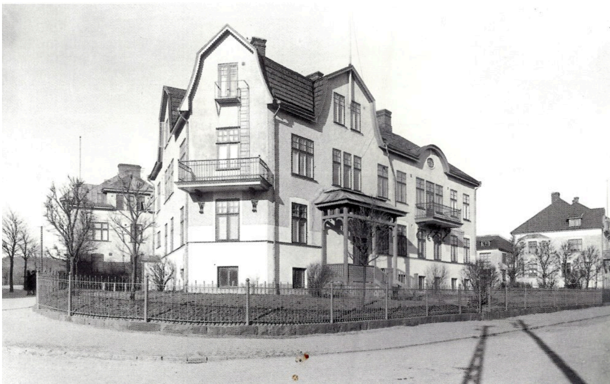
Norrbylånggata 1 Oscar Jacobsson