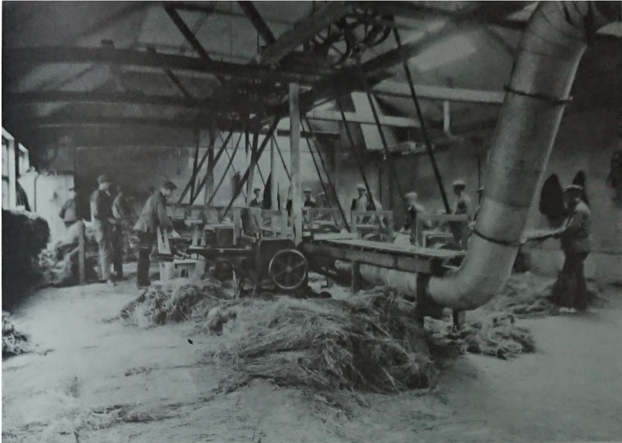
Linväveriet i Dalsjöfors

Linväveriet Dalsjöfors AB grundades år 1897 av Herman Jansson, Henning-Wenander och Martin Wenander. Den första fabriksbyggnaden bestod av två våningar med vind. Bottenvåningen byggdes av natursten och resten i trä. För driften av fabriken använde man en vattenturbin som matades via en tub av en 15 meter hög fors i ån Sågebäcken men kompletterade snart med en ångmaskin. I början expanderade verksamheten, en av de viktigaste processerna inom linnefabrikationen är blekningen och därför uppförde en särskild blekeribyggnad. År 1904 startades även ett linspinneri med cirka 1800 spindlar och innan dess hade garnet importerats från Tyskland. Redan 1906 byggdes ett nytt väveri, verksamheten expanderade nämligen kraftigt och innebar också att behovet av garn ökade varför också spinneriet byggdes ut i flera etapper.